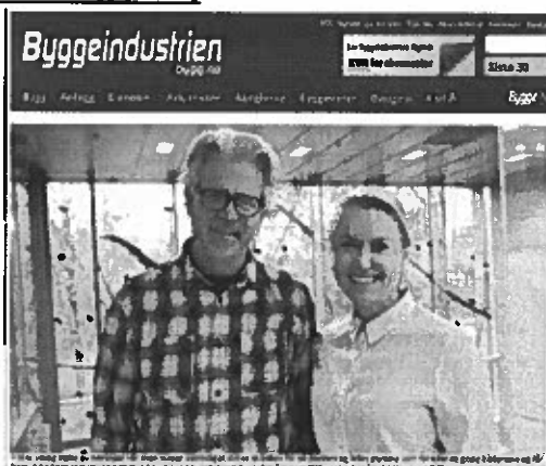
BAE-rådet vil samle ledere fra byggenæringen

Samferdselsforum og EBAs Anleggsgruppe samt RIFs og EBAs BIM-grupper.